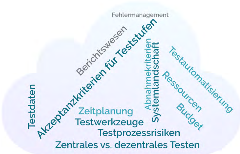
Abbildung 1: Potenzielle Einflussfaktoren auf die Testplanung

Zunächst schätzen wir den erforderlichen Testaufwand sowie das notwendige Budget ab. Dabei haben viele weitere Aspekte Ihres Systemkontextes einen maßgeblichen Anteil an den anstehenden und zu planenden Testaktivitäten. Solche Aspekte, zu denen u. a. der zugrundeliegende Entwicklungsprozess und regulatorische Anforderungen zählen, behalten wir bei der Planung der Testaktivitäten fest im Blick.